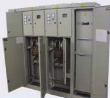
ВРУ, УВР, ИВРУ