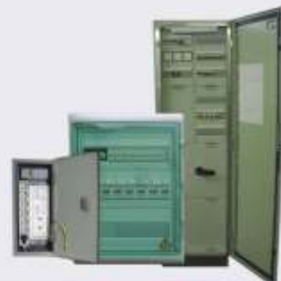
Любые нестандартные схемы и изделия