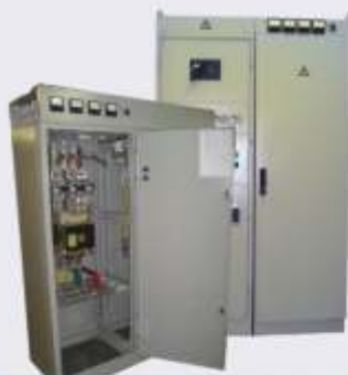
ЩО-70, ЩО-91, ГРЩ

Практически все наши выпускаемые изделия являются уникальными, хотя они во многом и схожи с типовыми. Нестандартность наших изделий говорит об индивидуальном подходе к каждому проекту и является одним из достоинств нашей работы. Мы всегда идем навстречу клиенту и сделаем именно то изделие, которое необходимо клиенту!