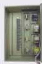
Щиты автоматизации КипПа

Щиты автоматического переключения на резервное питание.